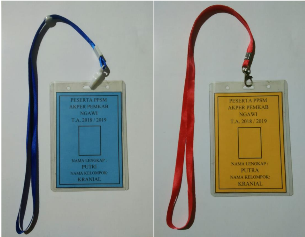
(Gambar: ID card )