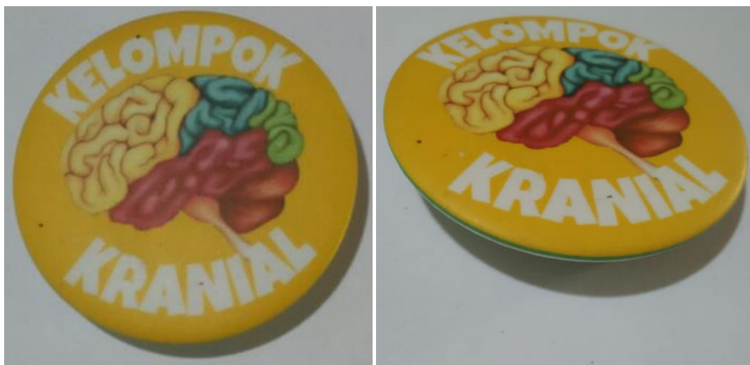
(Gambar: Contoh Pin Kelompok)